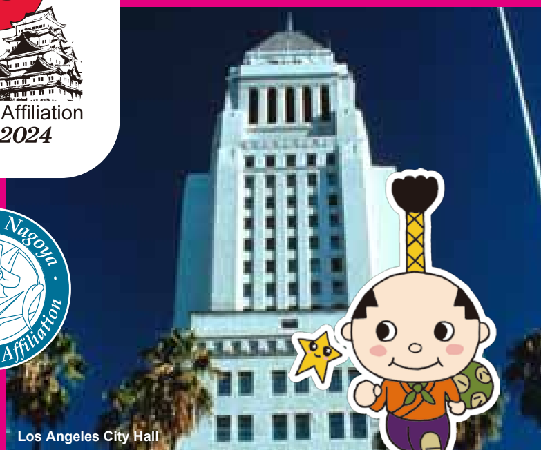
Los Angeles City Hall