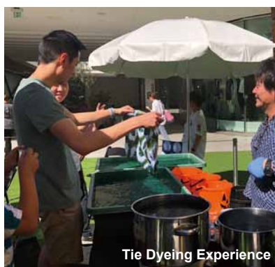
Tie Dyeing Experience