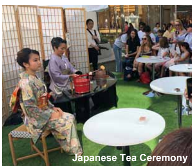
Japanese Tea Ceremony