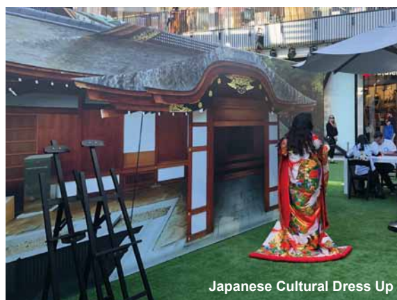
Japanese Cultural Dress Up